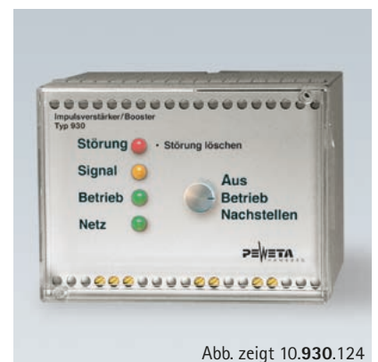
Abb. zeigt 10.930.124

▲ Impulsverstärker im Kunststoffgehäuse für Wand-/Hutschienenmontage