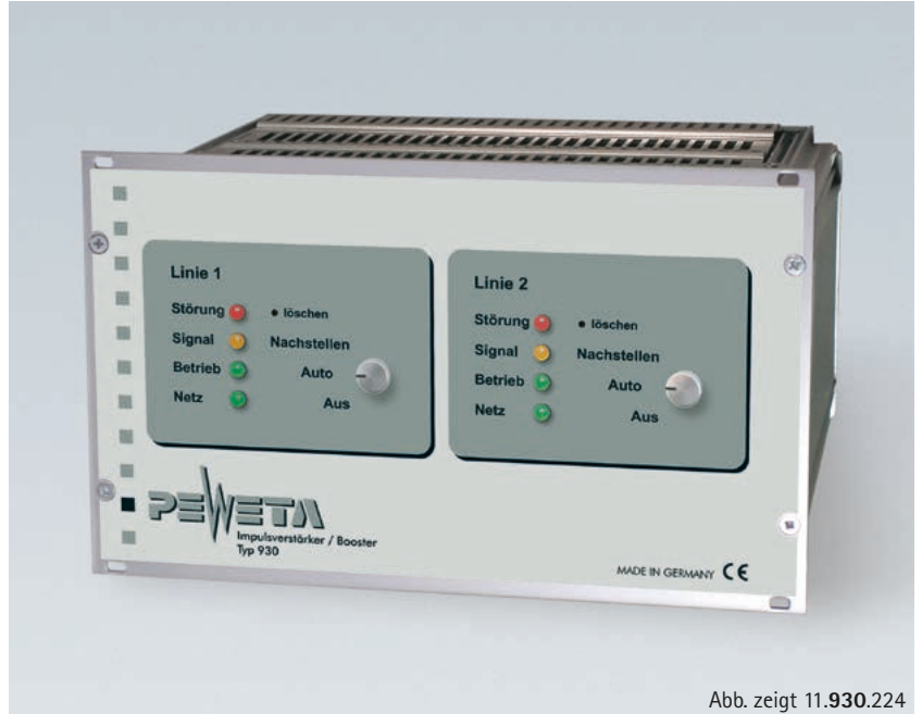
Abb. zeigt 11.930.224

Metallgehäuse als Einschubkassette für den Einbau in 19" Baugruppen-träger B 213 (42 TE) x H 128 (3 HE) x 230 mm. Betriebsspannung 230 VAC/50–60 Hz.