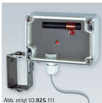
Abb. zeigt 03.925.111

Das DCF77-Zeitzeichentelegramm, gesendet auf der Frequenz 77,5 kHz vom deutschen Zeitzeichensender Mainflingen bei Frankfurt, ist ein übergeordnetes Zeitnormal zur Synchronisation sowie zur automatischen Sommer-/Winterzeitumstellung von Funkuhren und Zeitdienstanlagen. Dieser PEWETA DCF77-Funkempfänger liefert die Zeit- und Datuminformationen an alle PEWETA-Hauptuhren.