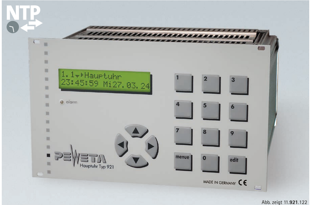
Abb. zeigt 11.921.122