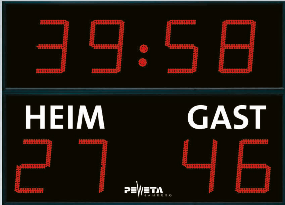
Abb. zeigt 24.830.422

Spielergebnis-Anzeigetafel in LED-Anzeigetechnik, 7-Segment- Anzeigen, Ziffernhöhe 460 mm, Lesbarkeit bis ca. 180 m. Geeignet für Fußball, Rugby und Feldhockey.