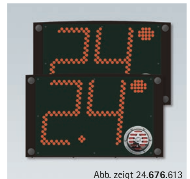
Abb. zeigt 24.676.613