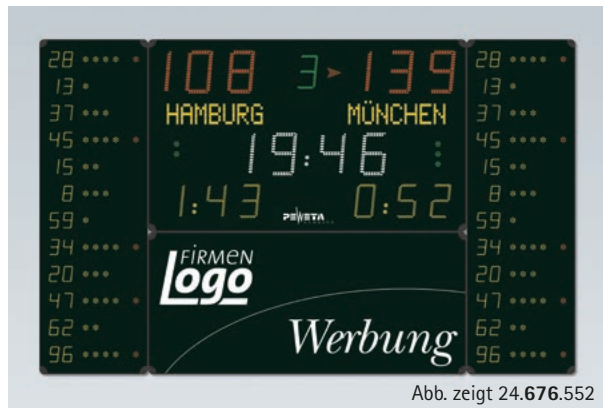
Abb. zeigt 24.676.552

Spielergebnis-Anzeigetafel mit LED-Textdisplay für die Mannschaftsnamen