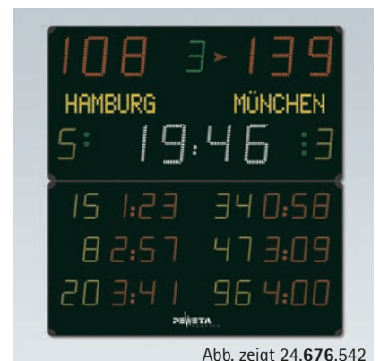
Abb. zeigt 24.676.542

Stabile, schwarz lackierte Metallgehäuse für Wandmontage, Frontscheiben aus entspiegeltem Polycarbonat, ballwurfsicher nach VDE 0710, Teil 13:1981-05 und DIN 18032, Teil 3.