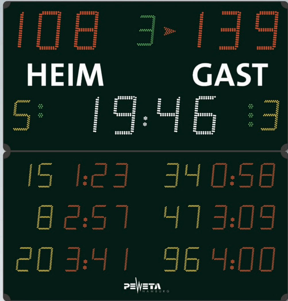
Abb. zeigt 24.676.541

Spielergebnis-Anzeigetafeln in LED-Anzeigetechnik, bestehend aus einer Hauptanzeigetafel und einer 3-zeiligen Strafzeitanzeige. Die Hauptanzeigetafel kann im Einzelbetrieb für alle gängigen Hallensportarten genutzt werden. Für die Sportarten Handball und Hockey können in der Zusatzanzeige bis zu 3 Strafzeiten je Mannschaft mit einer jeweils 2-stelligen Spielernummer angezeigt werden.