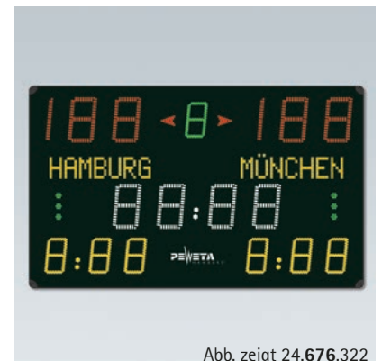
Abb. zeigt 24.676.322

Stabiles, schwarz lackiertes Metallgehäuse für Wandmontage, Frontscheibe aus entspiegeltem Polycarbonat, ballwurfsicher nach VDE 0710, Teil 13:1981-05 und DIN 18032, Teil 3.