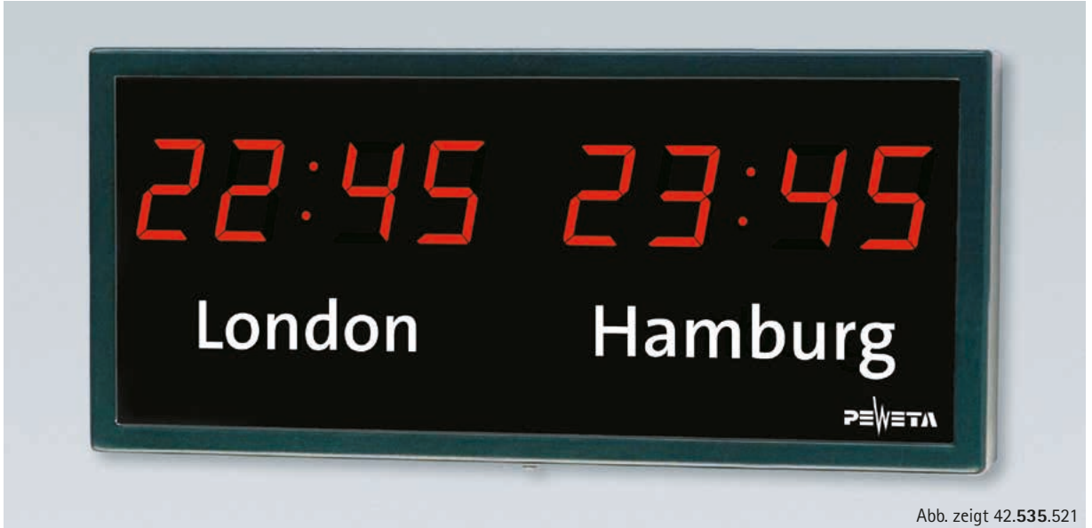
Abb. zeigt 42.535.521