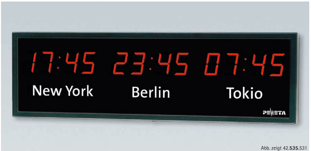
Abb. zeigt 42.535.531

Diese PEWETA-Weltzeit-Displays sind sowohl einzeln als auch in Kombination mit weiteren LED-Weltzeit-Displays einsetzbar. Die gewünschten Städtenamen werden als Folienbeschriftung unter den Displays angegeben. In der Software sind bereits alle ortsrelevanten Daten als sogenannte „Städte-Presets“ hinterlegt, so dass auf allen Displays immer die korrekte Uhrzeit angezeigt wird.