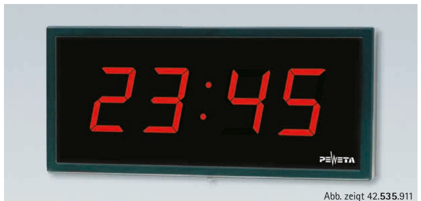
Abb. zeigt 42.535.911

Diese PEWETA-Weltzeit-Displays sind sowohl einzeln als auch in Kombination mit weiteren LED-Weltzeit-Displays einsetzbar. Die gewünschten Städtenamen werden als Folienbeschriftung unter den Displays angegeben. In der Software sind bereits alle ortsrelevanten Daten als sogenannte „Städte-Presets“ hinterlegt, so dass auf allen Displays immer die korrekte Uhrzeit angezeigt wird.