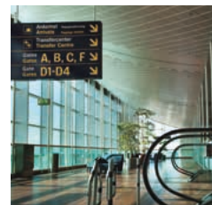
Innenuhren digital einseitig