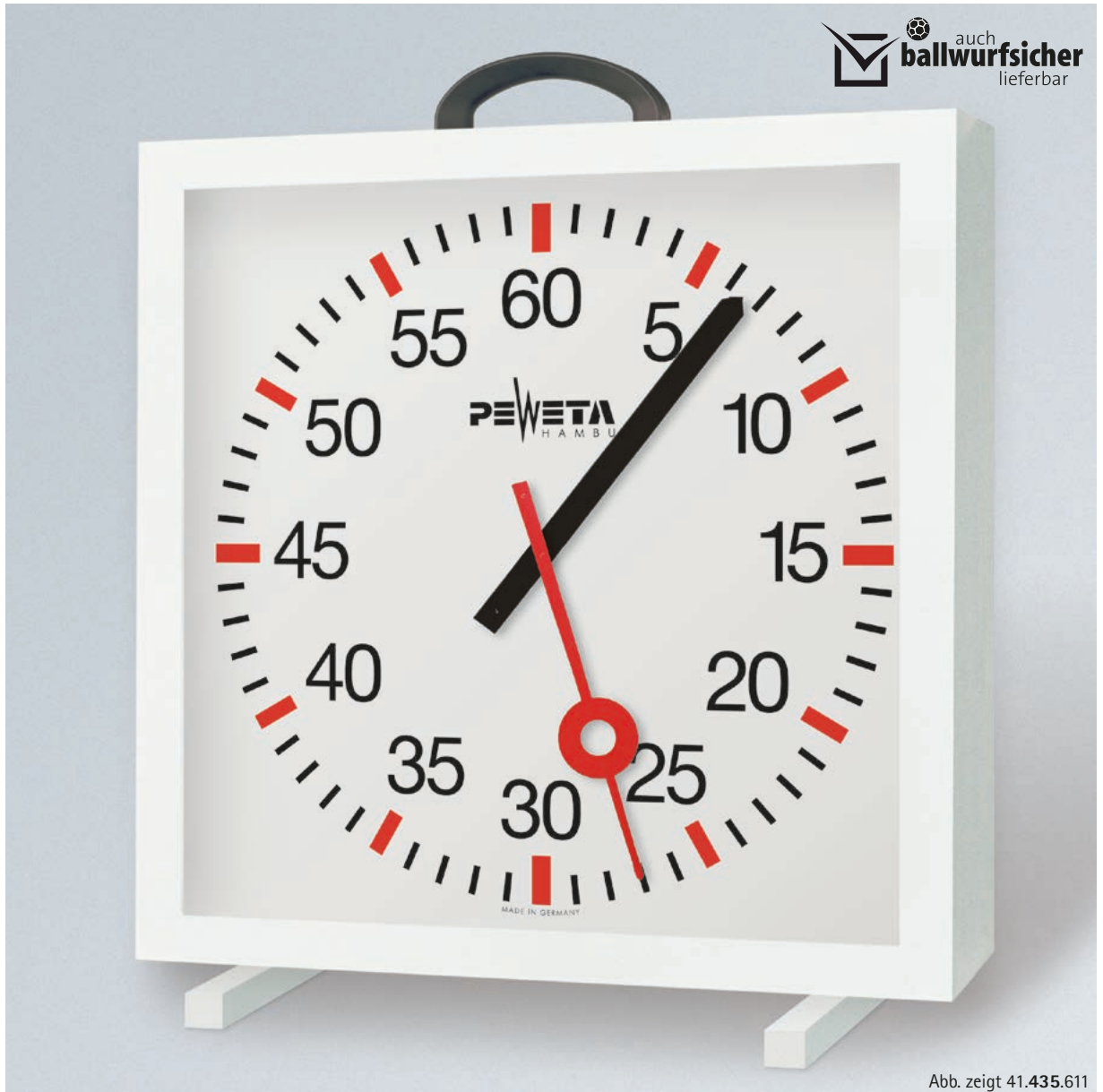
Abb. zeigt 41.435.611

Stoppuhr für den Sportbetrieb mit den Funktionen »Start«, »Stopp«, »Reset« und »Zwischenzeit«. Die Uhr zeigt die abgelaufene Zeit in Minuten und Sekunden an.