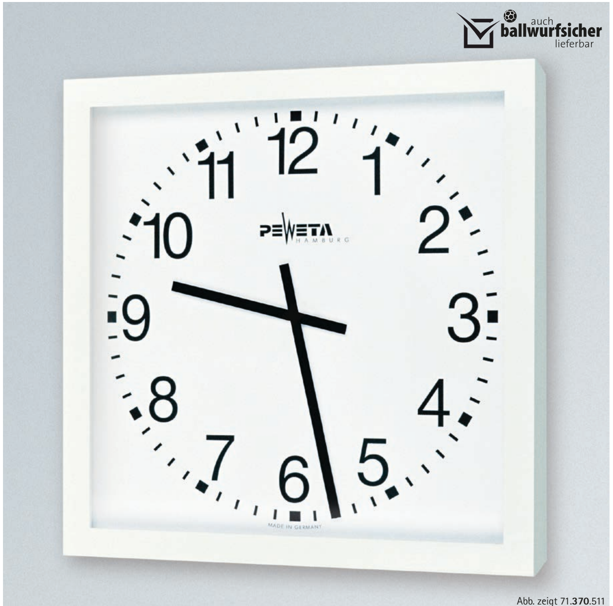
Abb. zeigt 71.370.511

Überall dort, wo in Großraum- umgebungen Uhren mit Metallgehäusen in robuster Industriequalität gefordert werden, ist die Wahl von Innenuhren aus dieser Typreihe die richtige Entscheidung.